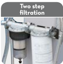
Two step filtration