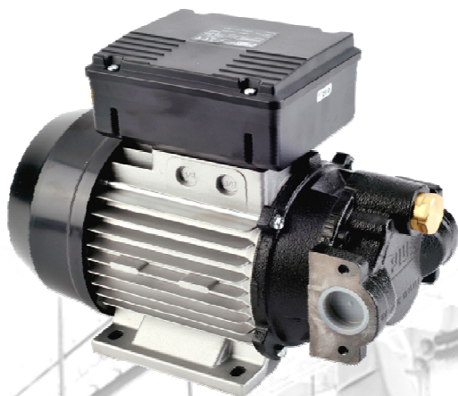
P3349 390 € Pompe Transfert Huile 230V 25 l/min - 6 bars - 500 Cst - 1" F