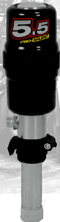
P214 360 € Pompe de Service Pneumatique 15,5 l/min - 45 bars